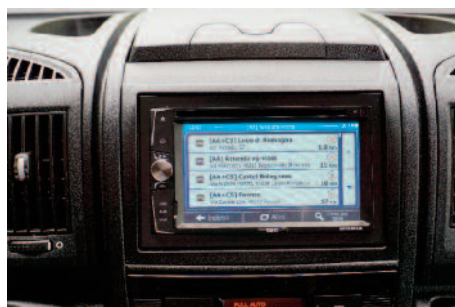
Navigatore touch screen 6.2 HD