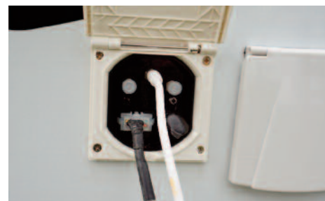
Attacchi esterni per l'ACTIV SAT Smart

sto, puntamento antenna (16 satelliti) ed altro: tutto con il telecomando. Utilizza un Unità di controllo DVB-S2 HD.