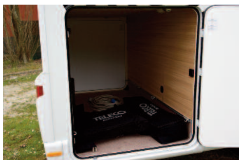
Ingombro dell'ACTIV SAT