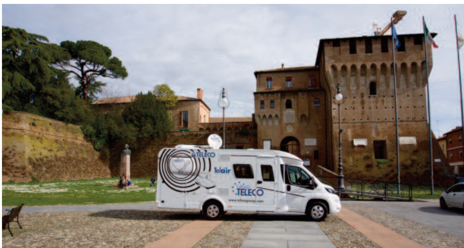
Camper Dethleffs attrezzato Teleco

Del gruppo poi fa parte la TELAIR che produce una nuova linea di climatizzatori per camper e caravan e propone anche