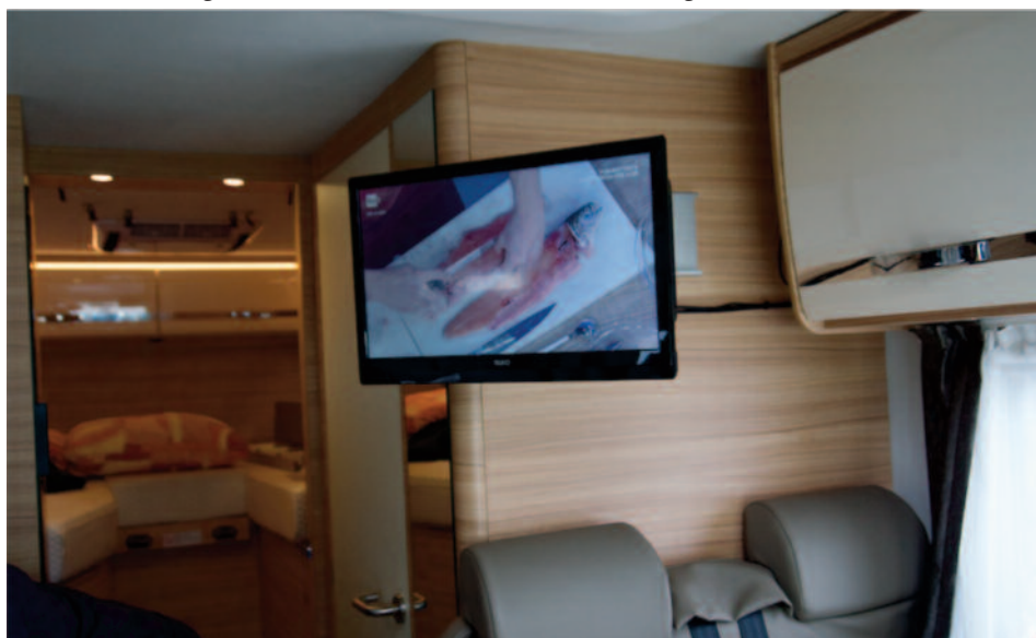
Tv Smart Teleco

► tronic. E' dotato del dispositivo DSF90E/HD che indica sia l'elevazione sia la potenza del segnale. Il MOTOSAT è un sistema di antenna satellitare semiautomatico dotato di motore elettrico a 12 V con due pulsanti che agevolano molto l'operazione di sollevamento e abbassamento dell'antenna e rende più veloce il puntamento del satellite. Con il DigiMatic il MOTOSAT si dota di puntatore digitale e di inclinometro elettronico, consentendo di puntare velocemente senza ritardi di segnale. Ricordiamo anche INTERNET SAT , l'Antenna satellitare automatica con Internet e TV. L'Internet Sat Teleco offre la possibilità di usufruire anche sul mezzo