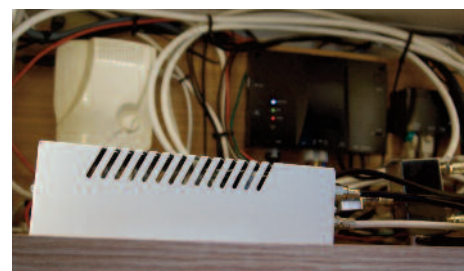
La Teleco Hub nell'armadietto superiore

Altro gioiello di casa è la FlatSat Komfort 2 SMART 65 e 85 , un'antenna satellitare automatica abbinata alla TV, con un TV SMART TELECO , televisore intelligente che funziona anche come pannello di controllo per tutte le operazioni: avvio antenna, ricerca del satellite giu-