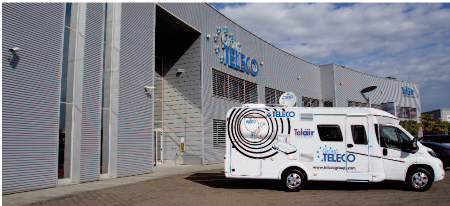
La sede Teleco Group con camper Dethleffs attrezzato

A bbiamo visitato una delle eccellenze italiane che ben rappresenta la vivacità creativa italiana e la capacità di stare sul mercato nei campi dell'innovazione tecnologica più avanzata collegata ai mezzi del turismo itinerante. Una PMI collocata in Romagna, nella zona industriale di Lugo, una città che conserva una bellissima rocca estense e che ha dato i natali a Francesco Baracca, glorioso aviatore della prima guerra mondiale.