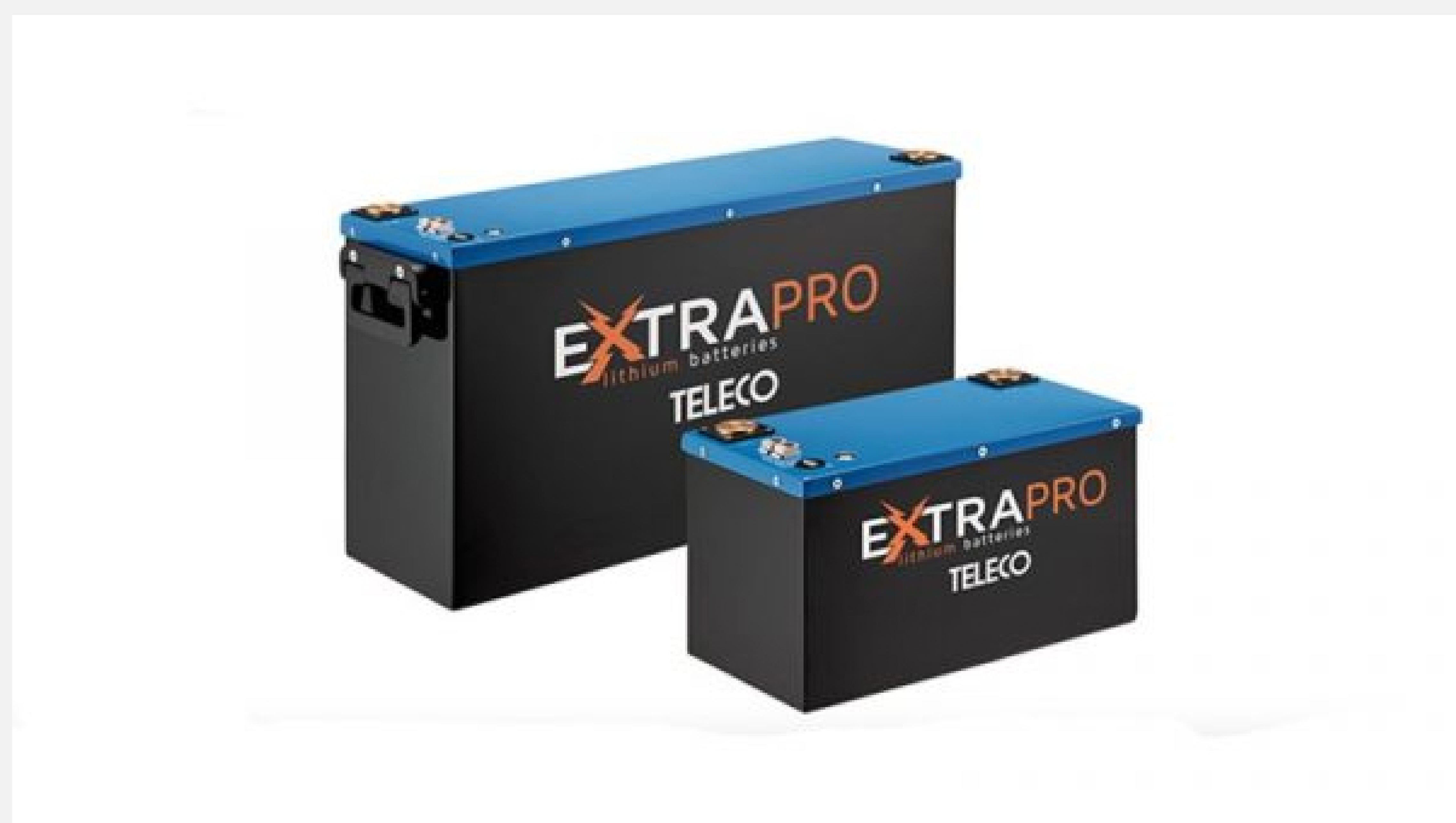
Batteries Teleco Lithium Ion Extra Pro© DR

>>> Découvrez comment gagner de l'autonomie avec les batteries Teleco